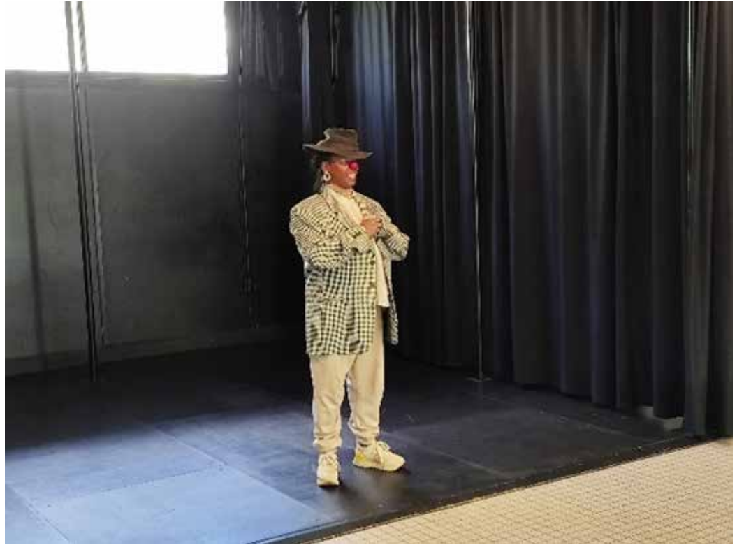
Saravasti – S.