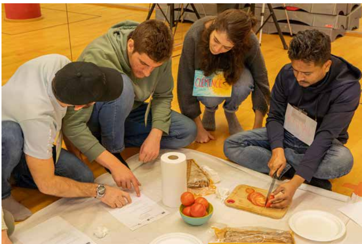
Fotografía 1 • Fotografía tomada por Juliana Marín, Archivo TransMigrARTS©

les compétences des migrant-e-s à travers les arts vivants. Dans le contexte général du projet, le prototype d'atelier Respirons vise à faciliter la formation de réseaux de soutien et de solidarité pour la vie en collectivité au sein de la population migrante. Cependant, la possibilité de construire des réseaux sociaux et de partager en communauté nécessite le développement de formes de communication qui permettent de dépasser la limite posée par l'absence d'une langue commune. C'est pourquoi cet atelier d'arts vivants utilise divers moyens d'expression tels que la danse, l'action corporelle, le dessin, la peinture et la cuisine comme stratégies symboliques pour partager des expériences de bien-être et, en même temps, pour permettre aux participant-e-s d'apprendre ensemble une nouvelle langue : la langue de la culture d'accueil, qui est dans ce cas le français.