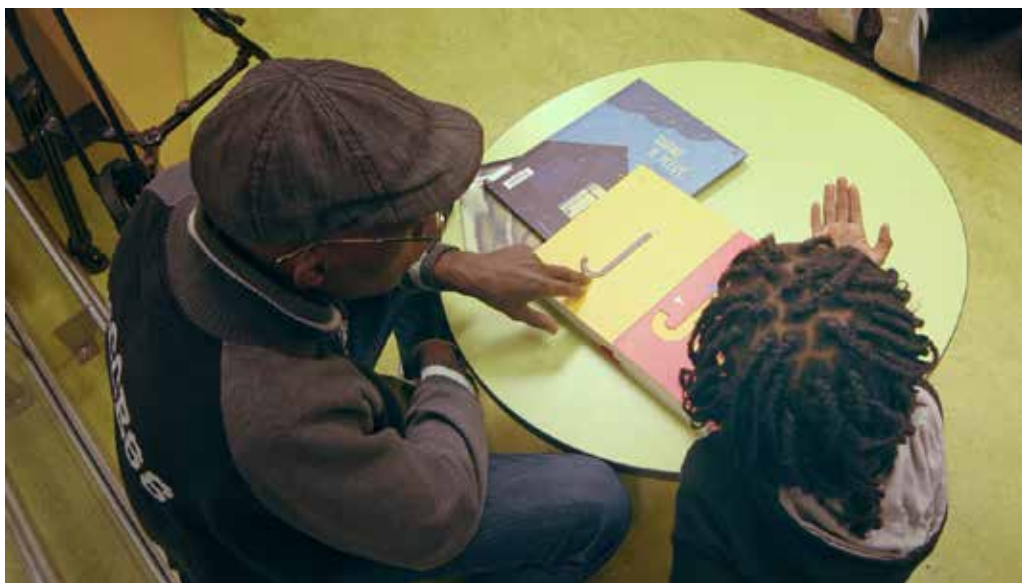
Fotografía 3 · Fotografía de Camilche Cárdenas©

tuamente, contribuyendo a crear un ambiente de cordialidad y apoyo mutuo. A continuación, presentaremos las dificultades expresadas según se referían a limitaciones contextuales más amplias, a dificultades sentidas en relación con el dominio de la lengua, a temores o desafíos relativos a la relación afectiva entre padres, hijos y lectura y, por último, a la preocupación por la transmisión simbólica del patrimonio cultural.