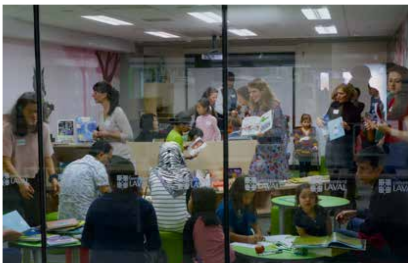
Fotografía 2 · Fotografía de Camilche Cárdenas©

En cuanto al segundo colaborador, el centro de educación para adultos Louis-Jolliet, es un centro que acoge a más de 700 alumnos en aprendizaje del francés de más de 60 nacionalidades, algunos de estos sin saber leer ni escribir en su propia lengua materna, también acoge a adultos quebequeses que no han completado su escolarización obligatoria y desean completar la secundaria. Situado en un barrio obrero y multicultural, el Centro Louis-Jolliet ofrece formación obligatoria en francés como lengua extranjera a inmigrantes alófonos (cuya primera lengua no es ni el francés ni el inglés, las dos lenguas oficiales del país). La dirección del Centro quería desarrollar una estructura de apoyo psicosocial para responder a las múltiples necesidades de sus distintos grupos destinatarios e integrar Lire Ensemble en las actividades destinadas a reforzar los vínculos entre las familias y las escuelas. Nos reunimos con todos los profesores de francés como lengua extranjera (todas mujeres) para presentarles el proyecto. Estas profesoras estaban contratadas y tenían un estatus precario, lo que implicaba una alta rotación. Su formación inicial variaba mucho en función de su origen, pero ninguna de ellas había recibido formación literaria después de los cursos de francés de secundaria. Cuatro de ellas mostraron interés y se les concedió tiempo libre para asistir a los talleres que organizábamos en la biblioteca de la universidad.