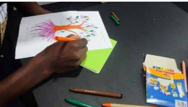
Imagen 2 • Ejercicio sobre el árbol.

y aunque el español fue el que permitió la comunicación entre todos, cada uno lo hablaba de manera diferente, por lo tanto, lo escribía también diferente. Las escrituras no fueron solamente poner en texto los monólogos de cada participante, sino dibujar sus mapas de viaje con colores, con trazos e imágenes particulares. Fue también señalar en un árbol sus raíces, su presente que les sostiene, su futuro sobre las hojas y ramas que van hacia arriba. Escribir sus historias fue también inventarlas a partir de objetos importantes para ellos; fue inventar, entre todos, los personajes, los lugares, los momentos; fue intentar responder preguntas sobre sus viajes para que entre todas esas voces se pudiese crear una coralidad.