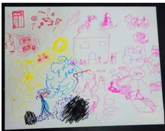
Imagen 5 • Cartografía de L. Archivos TransMigrARTS

L., tuvo necesidad de contar varias cosas a través de su dibujo. En el borde izquierdo, un poco más arriba de la mitad, lo empezó con un portarretrato de su perfil. Parecía como si desde allí estuviera viendo (o reviviendo) todo su viaje. Salió de Italia, pasó por Francia hasta llegar a España. Se observaba un momento difícil. “La emoción no