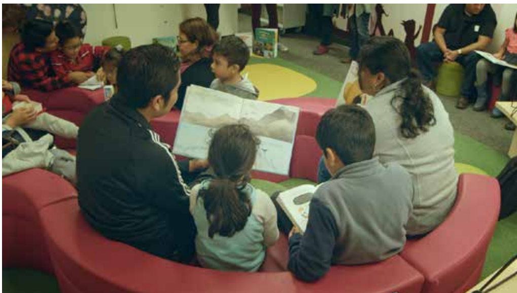
Fotografía 1 · Fotografía de Camilche Cárdenas©

aportándonos un toque de fantasía o calmando nuestras ansiedades; estas formas de leer se ven a menudo socavadas por las pruebas de la emigración. Los jóvenes y sus mentores las echarán de menos a la hora de encontrar los recursos que necesitan para crear un lugar en el que puedan florecer. Lo que está en juego puede parecer inmenso, pero es crucial para nosotros. No somos tan ingenuos como para creer que unas cuantas lecturas en familia, por muy esclarecedoras y significativas que sean, pueden resolver los numerosos obstáculos que conlleva un viaje migratorio. Pero sí creemos que contribuyen a aumentar la capacidad de simbolizar y dar sentido a la propia historia, y a reforzar la confianza en la propia voz, requisitos indispensables. Varias observaciones y testimonios nos llevan a creer que la mayoría de las personas que participaron en este proyecto, ya fueran destinatarios o trabajadores, vivieron una experiencia positiva, a veces llena de asombro, del encuentro con los libros. Pasaron un rato agradable, libres de la presión de ser productivos, y pudieron enriquecer sus relaciones interpersonales. Se sintieron seguros de sí mismos, reconocidos por su individualidad y acogedores con la de los demás 4 .